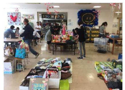
▲2017年に行っていた「みんなでフリマ」の様子です