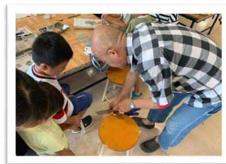
エンピツとき名人になろう