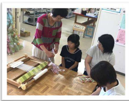
手織りにチャレンジ！ ミニマットをつくろう！