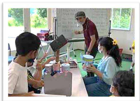
廃材で"がっき"を作ろう