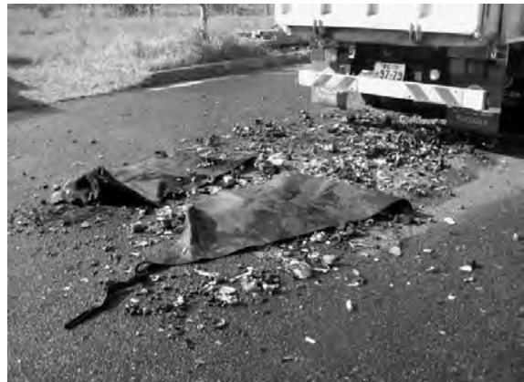
焼損したゴム製の防塵スカート